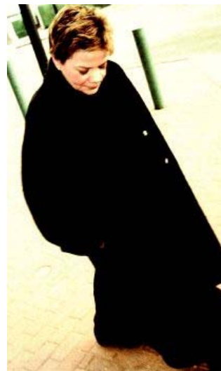
SALTO. La directora neoyorquina Marin Alsop.

La neoyorquina Marin Alsop acaba de romper una de las últimas barreras que quedaban por superar a la mujer en el mundo de la cultura: será directora titular de la Orquesta Sinfónica de Baltimore, una de las grandes formaciones de su país, a partir de septiembre del 2006. Es la primera mujer que ocupa la dirección de una importante orquesta sinfónica, un reducto hasta ahora estrictamente masculino, como si para empuñar la batuta fuese más necesaria la testosterona que el conocimiento de la arquitectura musical. Aún es pronto para saber si Alsop, de 48 años, dejará huella en la Sinfónica de Baltimore por la calidad de su trabajo, pero de momento ya ha conseguido entrar en la Historia.